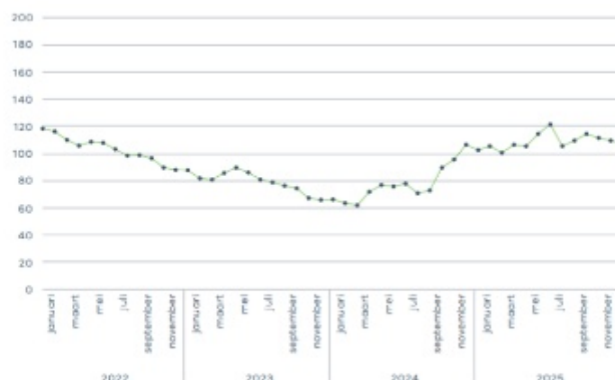
Koersevolutie in €

Je kan de koers van het What's Cooking? aandeel op elk moment raadplegen op de websites www.whatscooking.group en www.euronext.com